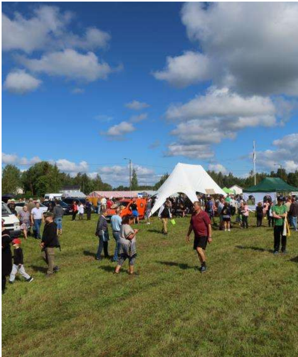
Askaisten kurkkumarkkinat 12.8.2023